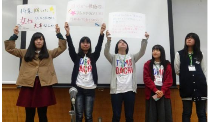
発表用紙を手に一生懸命にプレゼンテーション