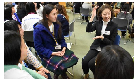
高校生の皆さんが進路について悩み相談をする場面も