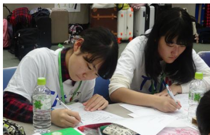
学んだことを忘れないようにメモをする姿が見られました