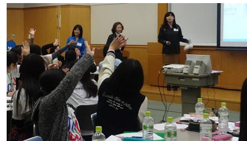
クイズを交えながら学んでもらいます

ファミリーマートの環境キャラクター「エコロン」と女性社員が高校生たちの前に登場！