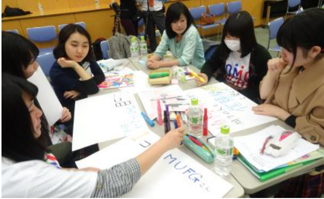
グループワークの様子