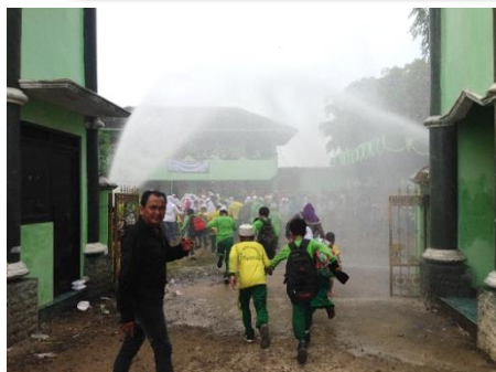
連日の暴雨のシミュレーションで避難訓練を実施