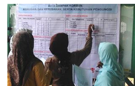
マネジメントセクターでデータを収集し災害状況を把握

ファミリーマートは、事業活動を通じて常にお客さま、地域社会、そして地球を幸せにする存在となることを目指します。