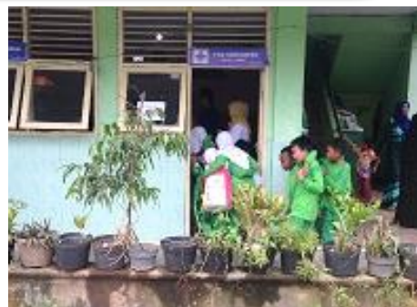
洪水災害時、避難所への移動を助けあう子どもたち