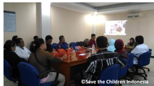
行政・学校・地域住民代表等が参加した避難訓練準備のための会議の様子