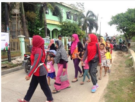
多民族、多宗教の子どもたちと地域住民が参加