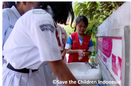
医療セクターで保健衛生係としての役割を担った子どもたちは手洗いの徹底を促進