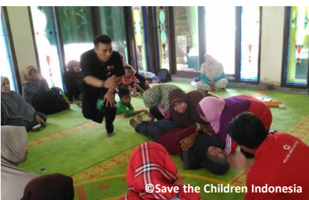
応急処置研修で学んだ手当てを避難訓練で実践する住民ら