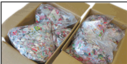
集まったベルマーク

ファミリーマートでは被災地支援として、ファミリーマート店舗と食品製造委託工場、および池袋本社回収活動で集まったベルマークを東日本大震災で甚大な被害を受けた被災地の学校へ寄贈してきました。 この活動は2011年度より実施しており、被災地のこどもたちへの育成支援として毎年継続して行っています。 今回は平成28年熊本地震によって被害を受けた熊本県の学校へ寄贈を行いました。