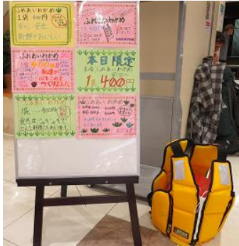
作成したPOPも工夫して展示。

販売日当日、盛岡市内2ヶ所で生徒の皆さんは2班に分かれて、販売実習を体験。授業で作成したPOPを貼って、自慢の「ふれあいわかめ」をきれいに陳列。自分たちでつくったチラシを大きな声で配布して歩いたおかげで、たくさんの方に来てもらえました。みんなで協力しながら頑張った成果があり、販売予定数の718袋は見事に完売！