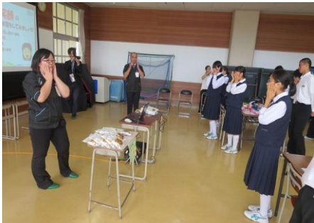
まずはいい笑顔をつくるため、顔をほぐします。意識して笑顔をつくるのって意外と大変！

「いらっしゃいませ。こんにちは」「ありがとうございます。またお越しくださいませ」の唱和とともにお辞儀の練習も行い、また、生徒の皆さんが売り手とお客さま役に分かれ、販売の実習も体験しました。お金を受け取る、商品をお渡しする、おつりをお渡しする…最初はぎこちなかった皆さんも、練習を重ね笑顔で「いらっしゃいませ！」の声も出せるようになりました。あとは本番当日の販売実習を待つばかりです！