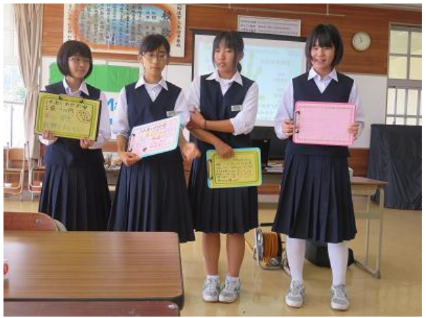
出来上がったPOPを披露！自分たちのわかめを買ってもらうため一生懸命PRします。