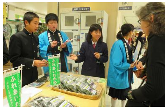
さあ、いよいよ販売のスタートです！