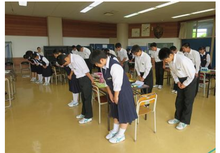
ありがとうございました！声を出しながら何度もお辞儀の練習をしました。