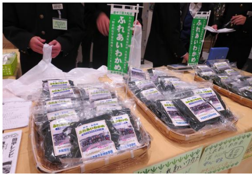
陳列もきれいにできました。