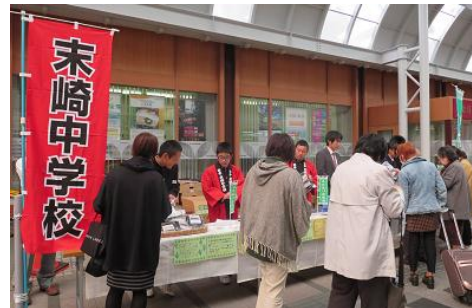
遠方からわざわざ足を運んでくれた方もいました。