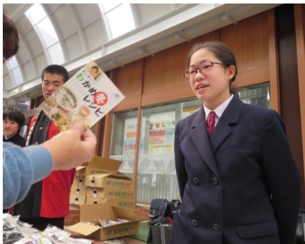
「どうやって食べるの？」というお客さまのためにレシピも用意。