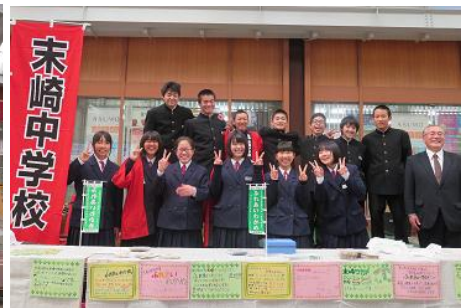
718袋すべて完売しました！お疲れ様でした！