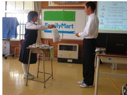
皆の前で練習の成果を発表し、良いところを皆で共有しました。