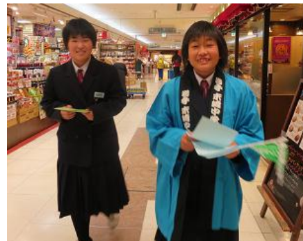
「私たちがつくった“わかめ”いかがですか〜」という声に、沢山のお客さまが来ていただきました。