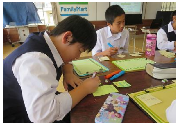
教わったことに自らのアイデアを加えて、わかめを買っていただくために一生懸命作りました！