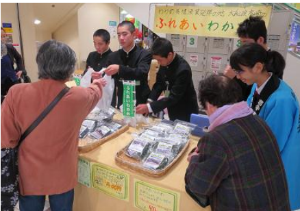
お客さまが受け取りやすいよう、レジ袋の持ち手をそろえてお渡します。