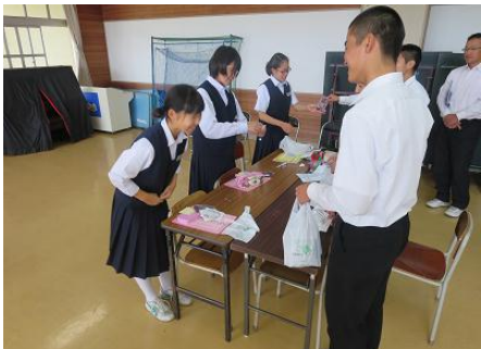
2人1組になってお客さまとのやりとりの練習を何度も繰り返します。