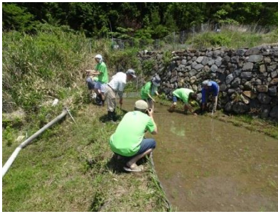
田植えの様子をパチリ