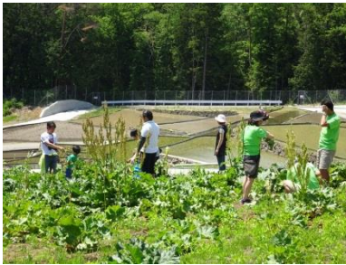
帰りに、日本ではまだ珍しいパーブ畑も見に行きました