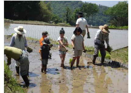
地元の小学生もお手伝い