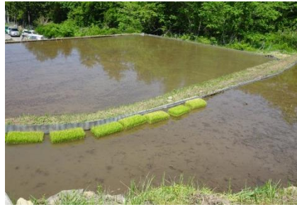
一面に稲穂が実る季節に思いを馳せて…