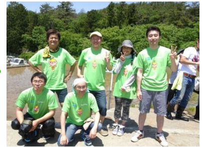
甲府営業所からの参加者