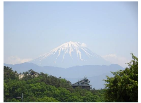
雄大な富士に見守られながら