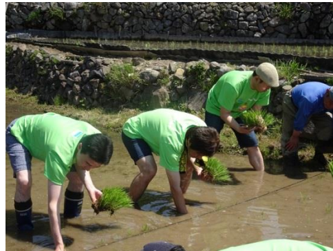
まっすぐに張ったロープに沿って植えていきます