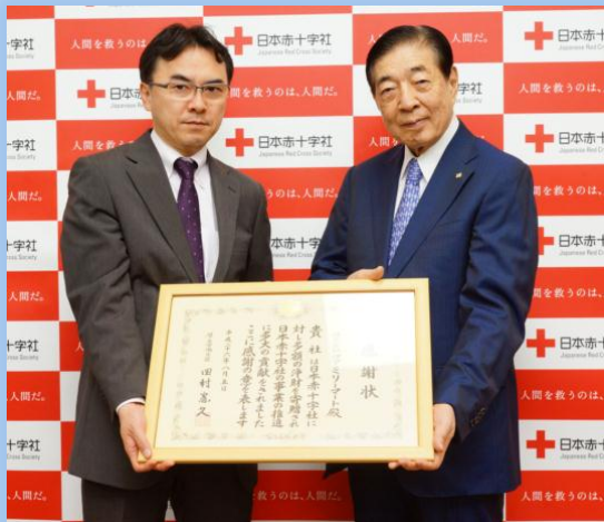
▲日本赤十字社の近衛社長（右）と 玉川CSR・コンプライアンス部長。

6月16日（火）日本赤十字社本社（東京都港区）にて、厚生労働大臣感謝状の国家表彰伝達式が開催され、感謝状を受領いたしました。ファミリーマートが2013年に中国四川省でおきた地震で被害を受けられた方々のために店頭で義援金募金を実施し、日本赤十字社の被災地救援活動に支援協力をおこなったことに対し贈呈されたものです。これは全国のファミリーマートの店頭でご寄付をいただいたお客さまの多大なご支援によるものであり、皆さまからのたくさんの支援にこの場を借りて改めて御礼申し上げます。