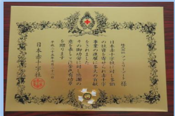
▲日本赤十字社からの表彰