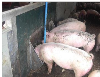
液体飼料(リキッドフィーディング)を食べる豚。