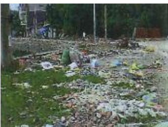
ハイフォン市のゴミの不法投棄。