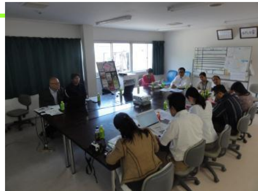
スライドでの講義を受講中。