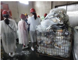
工場内を視察する研修生の皆さん。臭いに閉口。