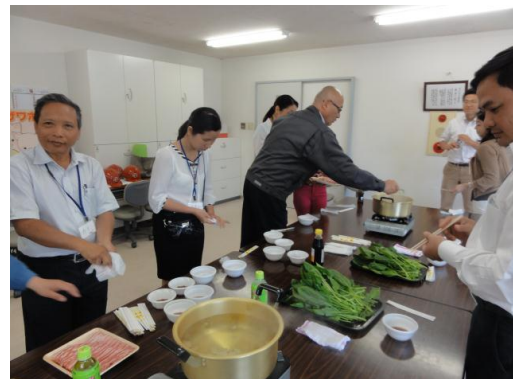
液体飼料で育てた豚肉の試食。研修生には大人気！