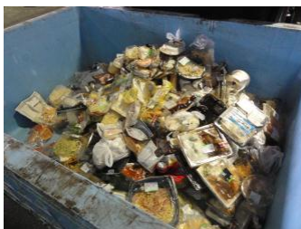
東京都内の店舗より運びこまれた食品残渣の一部