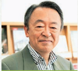
審査員長 池上 彰 ジャーナリスト

これまでの10回を振り返ると、ほほえましくこどもらしい手紙に心を動かされて、作品を選んでいました。しかし今回は、応募総数が増えたこともあるのか、文章力が格段にあがっており、結果として観察力、表現力が見事な作品を選ぶことができたという手ごたえがありました。反面、優れた作品の中から入賞作品を選ばなくてはならないという悩みもあるのですが、読んでいて思わず涙が溢れ出てきそうになる心うたれる作品も多かったですね。次回も素晴らしい手紙に出会えることを楽しみにしています。