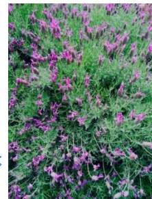
満開のラベンダー。 花を愛でながらのウォーキングは 最高です。