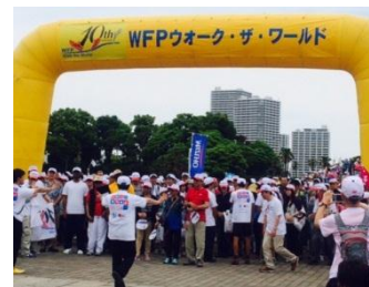
いよいよスタートです

ファミリーマートはこれからもこのような次世代を担うこどもたちの育成の取り組みを支援してまいります。