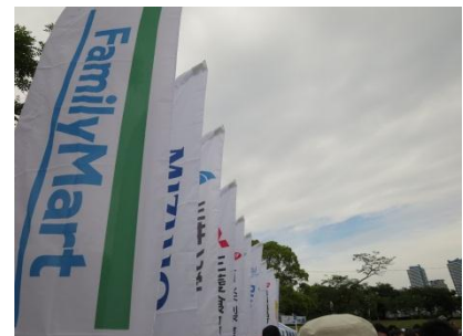
協力企業がずらり

ファミリーマートは、事業活動を通じて常にお客さま、地域社会、そして地球を幸せにする存在となることを目指します。