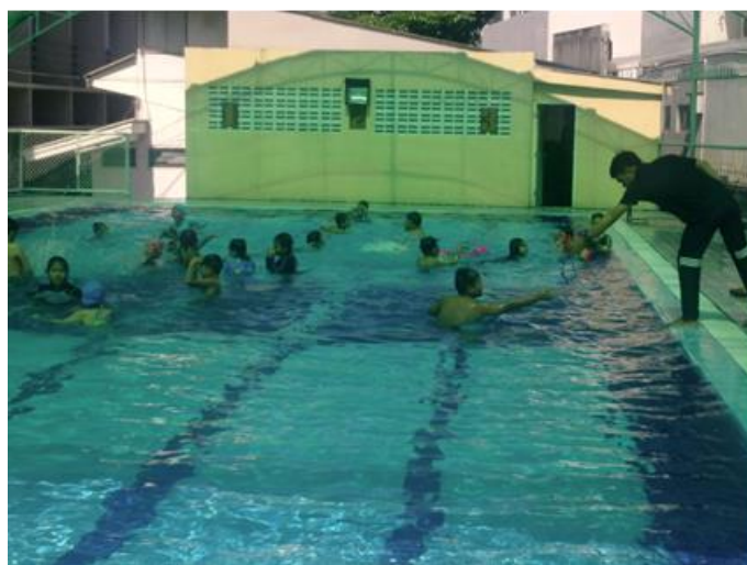
Phayathai 小学校のプール施設と水泳指導の様子 (2016年11月16日、同校にて撮影)