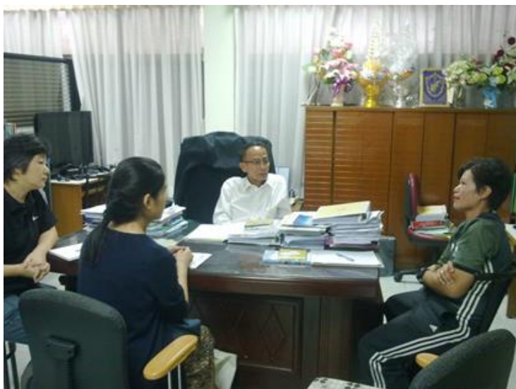
対象校に選ばれた Phanthai 小学校の教頭(中央)と水泳担当教員(右)との打ち合わせ (2016年11月16日、同校にて撮影)