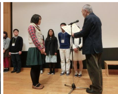
聞き書き甲子園優秀作品賞授賞式