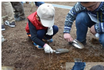
園児が成長したどんぐりを植樹

これから森ができることで、都心への風の道ができ、ヒートアイランド現象をやわらげることも期待されています。