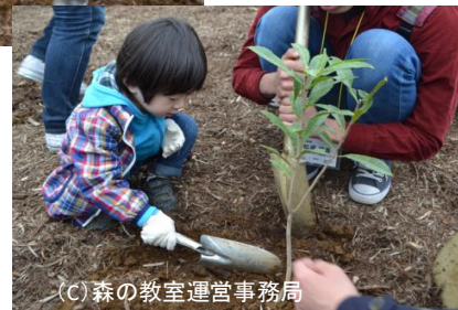
(C) 森の教室運営事務局