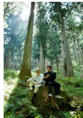
名人にインタビューする高校生

<聞き書き甲子園ホームページ： http://www.foxfire-japan.com/ >