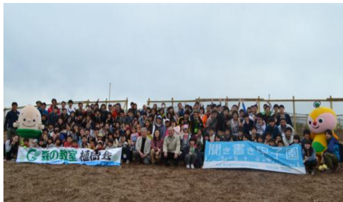
聞き書き甲子園参加者と森の教室に参加したみわ幼稚園児童たちが全員集合

*「森の教室 どんぐりくんと森の仲間たち」とは、(公社)国土緑化推進機構がファミリーマートの店頭募金「夢の掛け橋募金」の寄付により実施しているプログラムです。全国の幼稚園・保育園を巡回して、園児たちに森と生活との関わりを伝え、一緒に森を守り、育てることを学ぶ教室です。