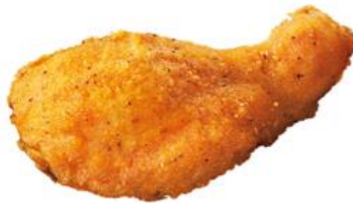
「ファミマプレミアムチキン（骨付き）」