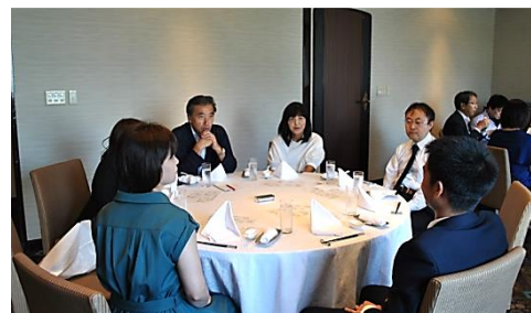
【2019年に開催した食事会の様子】

や、社内広報誌等を通じて、全国の店舗に事例を共有することで、さらに意識を高め合いながら、全社一丸となってSS活動に取り組んでおります。