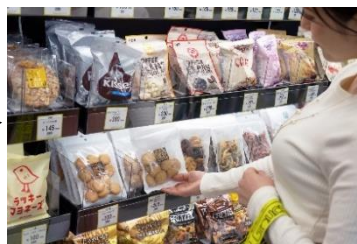
② 商品は手持ちのバックに入れても OK