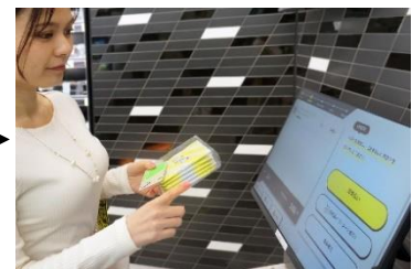
③ 出口のディスプレイで購入商品を確認して決済