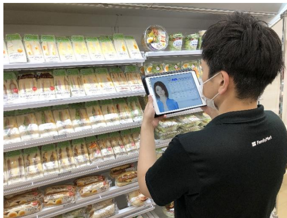
売場使用イメージ