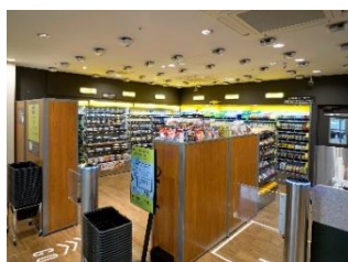
① 入店後、欲しい商品を手にする

商品を手に取り、出口でディスプレイの表示内容を確認し、支払いするだけでお買い物が完了します。