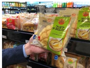
② 商品は手持ちのバッグに入れても OK