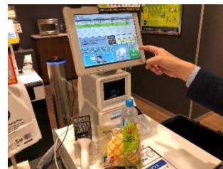
③ 出口のディスプレイで購入商品を確認して決済