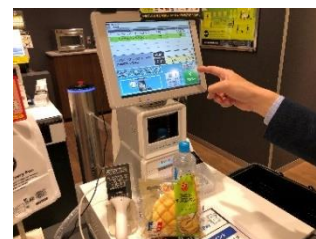
③出口のディスプレイで購入商品を確認して決済