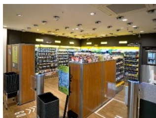
①入店後、欲しい商品を手取る

商品を手に取り、出口でディスプレイの表示内容を確認し、支払いするだけでお買い物が完了します。