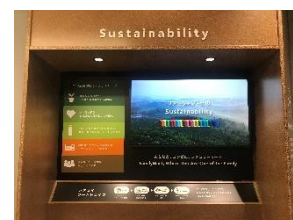
サイネージによるサステナビリティ取り組み紹介