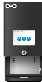
コカ・コーラ社のボナクア®ウォーターバー 水と炭酸水をお客さまへご提供

ファミリーマートは、「あなたと、コンビニ、ファミリーマート」のもと地域に寄り添い、お客さま一人ひとりと家族のようにつながりながら、便利の先にある、なくてはならない場所を目指してまいります。