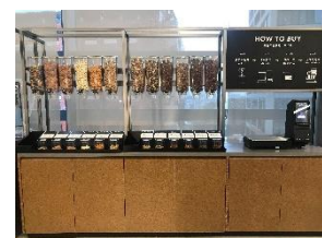
フードロスやプラスチック包装の削減につながる量り売りコーナーを展開

量り売りのお買い物を簡単にするセルフサービススケールとモーションセンサーを用いたセルフ量り売りソリューションは、株式会社寺岡精工が協力。