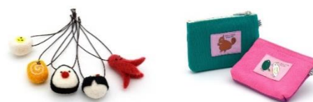
フェルトストラップ

環境や人に配慮し持続可能な方法で作られているものや、人の生活や環境の持続可能性を高めるような商品を展開。その中でも、東京都福祉局が運営する障害のある方が丁寧に作った個性的な手づくり品を販売する「KURUMIRU」（くるみる）で人気の商品をファミマ麻布台ヒルズでも品揃え。