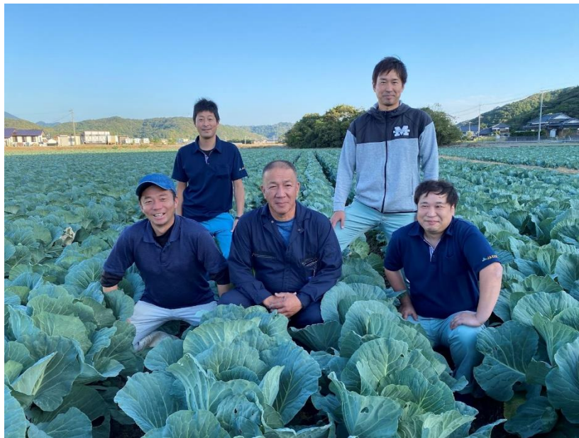
※JA むなかたのキャベツ生産者のみなさん

株式会社ファミリーマート（本社：東京都港区、代表取締役社長：細見研介）は、継続して取り組んでいる5つのキーワードの1つである、「食の安全・安心、地球にもやさしい」の一環として、プライベートブランド「ファミマル KITCHEN」から、JA むなかたとの取り組みである循環型農業で生産された「福岡県産キャベツを使った キャベツミックス」110円（税込118円）、「福岡県産キャベツを使った 千切りキャベツ」100円（税込108円）をパッケージに循環型農業で生産されたキャベツであることが分かるマークをデザインし2023年12月12日（火）から発売いたします。