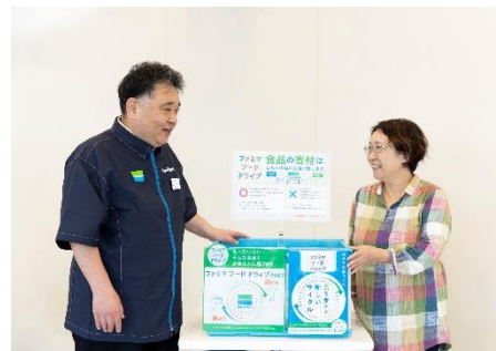
加盟店と協力パートナー

ファミマフードドライブは、ご家庭の食べきれない食品を入れていただくための専用の回収ボックスを店舗に設置します。集まった食品を地域で子ども食堂やフードパントリーなどの活動に取り組む協力パートナーを通じて、食支援が必要な方々へお届けいたします。現在、協力パートナーは、NPO法人や社会福祉協議会、自治体などを中心に384団体（2023年10月末時点）となっております。