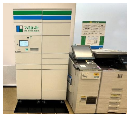
ファミロッカー（左）

https://www.family.co.jp/services/delivery/locker/shop_list.html