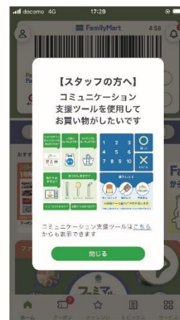
④レジ会計時に上図画面をストアスタッフに見せる