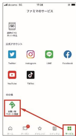
①サービス画面内の「お買い物サポート機能」をタップ