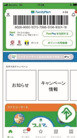
③ホーム画面右下の「耳マーク」をタップ