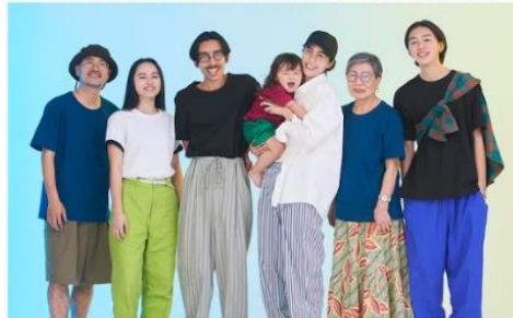
いい素材、いい技術、いいデザイン。