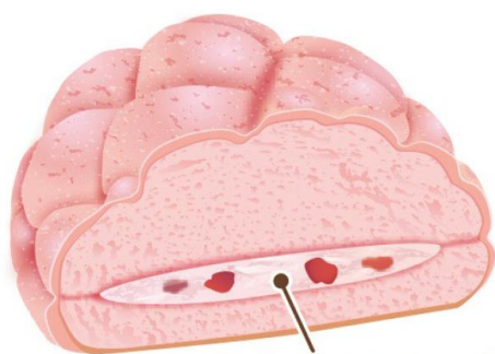
いちご果肉入りホイップ イラストはイメージです

「いちご果肉入りホイップのメロンパン」は、いちご風味の生地と、いちご風味のビスケット生地と、つぶつぶ食感のいちご果肉入りのホイップをサンドしました。「いちごのティラミス」は見た目も可愛い 5 層に仕上げています。一番下には甘ずっぱい果肉入りいちごソース、2 層目にはティラミスムース、3 層目はいちごスポンジとシロップを重ねました。