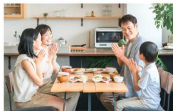
うれしいへの取り組み

「あったらいいな」が見つかる驚きと、価格以上の価値が得られる満足感。定番からトレンド、名店コラボなど、あらゆる世代の方が笑顔になるラインアップ。そんなさまざまな「うれしい」を提供するために、お客さまの声を取り入れ、その期待を超える商品の開発や発信に取り組んでいます。