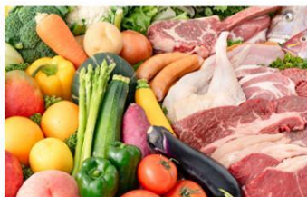
おいしいへの取り組み

原材料や製法に独自の商品開発基準を設定し、他社商品との比較調査、味覚調査などの取り組みを徹底。毎日食べても飽きない味わいや、ひと手間かけた本格感、彩りや香りなど、多種多様な「おいしい」を提供するために、一つひとつこだわりを追求していきます。