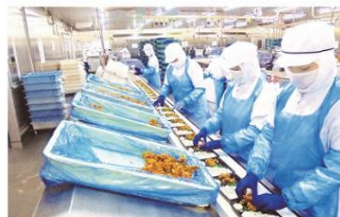
あんしんへの取り組み

独自の基準をクリアした工場だけを選定し、商品に適した品質管理を徹底。出荷時のクオリティを保つ効率の良い配送。さらに、環境に配慮した容器や持続可能な原材料の活用など、家族や地球にとって「あんしん」な毎日をつくるため、品質管理はもちろん、サステナブルにも積極的にチャレンジしていきます。