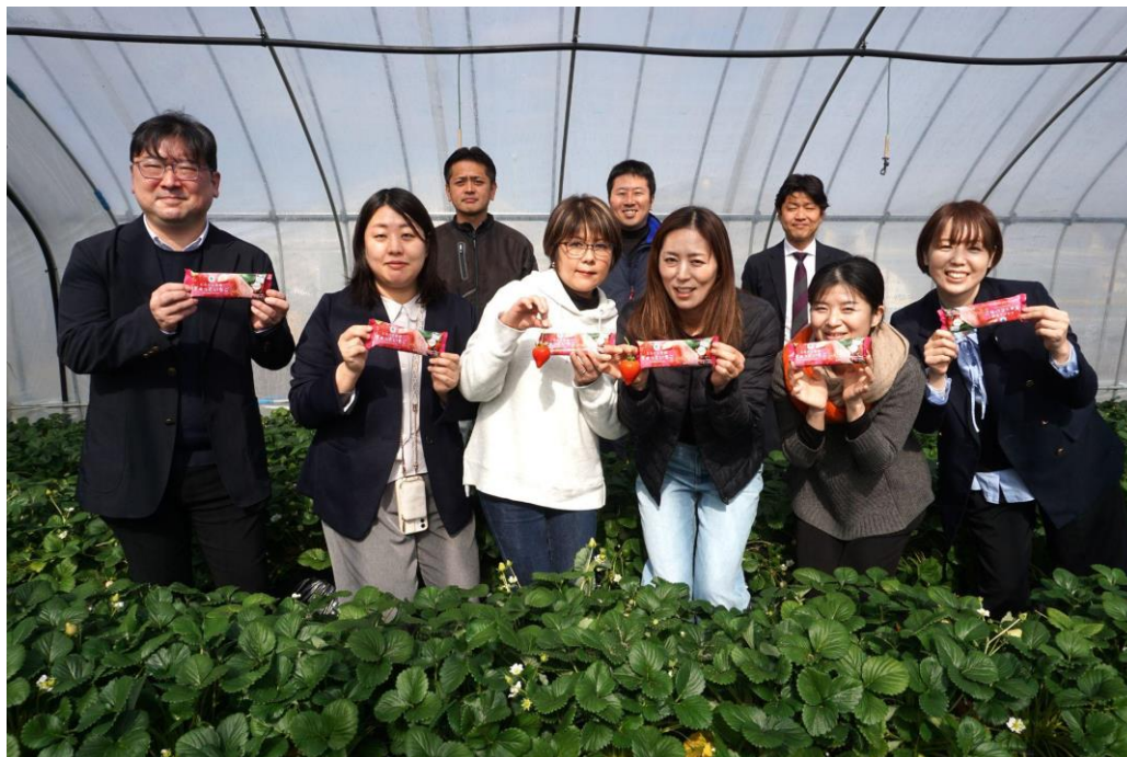
農家の皆さま、JA 全農さま、ファミリーマート社員

300種以上の品種がひしめく「いちご戦国時代」において、優れた品種でもその名が浸透し、定着することは容易ではありません。そこで本商品では、あえて「いちご果汁」ではなく『とちあいか果汁』と品種名をパッケージ前面に掲げました。お客さまがその名前を覚え、ファンになっていただく。それが、育てやすく美味しい『とちあいか』の普及を後押しし、ひいては持続可能な農業へと繋がっていきます。半分に切ると現れる、愛らしいハートの形。その中には、農家さんの負担を和らげ、伝統を次世代へ繋ぎたいという栃木県の「愛（あい）」が詰まっています。この一本を味わうことが、産地の笑顔を支える力になる。美味しく食べて、産地を「推す」。そんな新しい応援のカタチを、ぜひ体験してください。