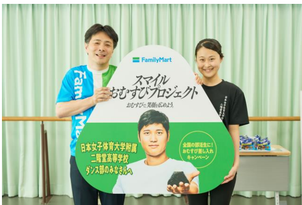
「スマイルおむすびプロジェクト」記念パネルの贈呈