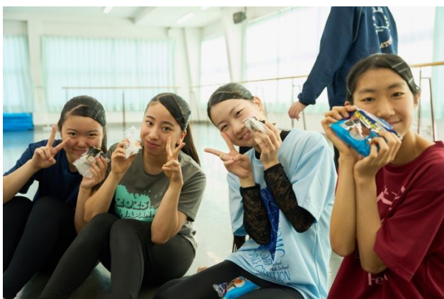
差し入れされたおむすびを頬張る生徒たち