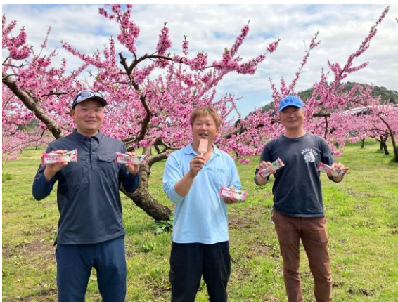
試食している農家さん

産地と店舗、そしてお客さまを「おいしい」という体験で繋ぎ、持続可能な地域支援の輪を広げてまいります。