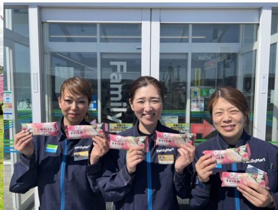
福島の店舗のみなさん