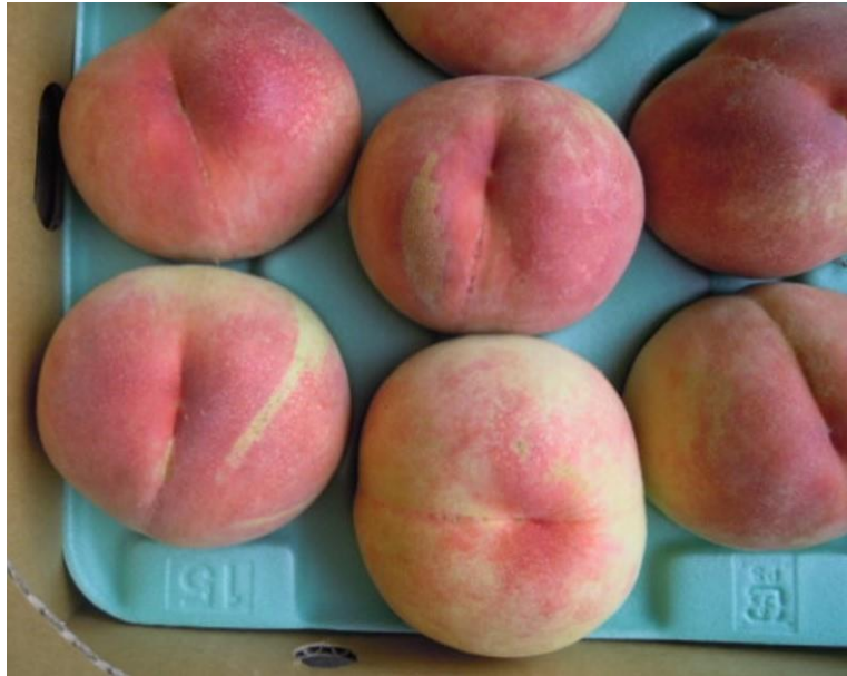
表皮の傷により規格外になった桃