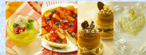
《 Sweets+ 》