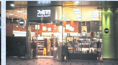
《 ファミマ!! 虎ノ門四丁目店 》