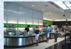
《 Famima !! (アメリカ) 》