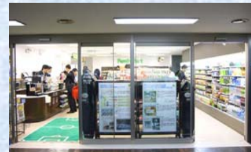
《 埼玉県庁店 》

出店数：268店舗 ※ 他「TOMONY」7店舗を出店 新設店日商：485千円（前年同期差 +42千円）