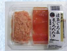
《 漬まぐろ&まぐろたたき 》