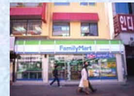
《 韓国FM 》