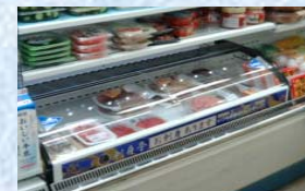
《 お刺身売場 》

差益率 上期実績：28.79% (前年同期差 ▲0.43%) ※ 煙草除く前年同期差 +0.50%