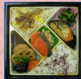
〈とっておきの生クリームプリン〉 〈紅鮭と鯖照り焼きの幕の内弁当〉