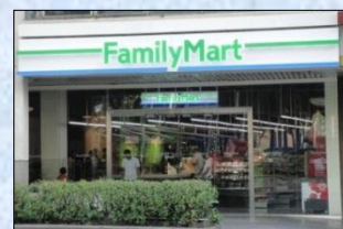
〈フィリピン1号店 FamilyMart Glorietta3店〉