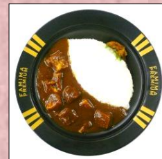
〈ファミマ プレミアムビーフカレー〉