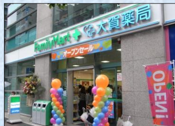
〈大賀薬局店屋町店(福岡県)〉