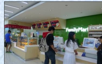
〈インドネシア 店内の様子〉