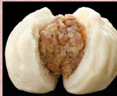
〈ファミマ プレミアム肉まん〉