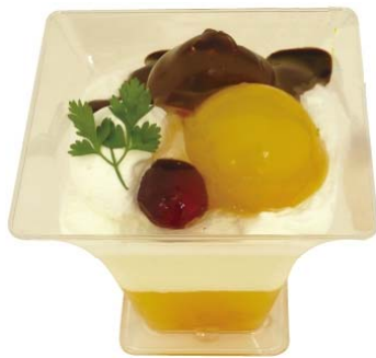
2008年6月10日発売の 加盟店のアイデア募集企画第1弾、 「オレンジとレアチーズのドルチェ」

加盟店のアイデアを商品化！ 「食べたい！」をカタチにした、ワクワクするデザートが誕生しました。