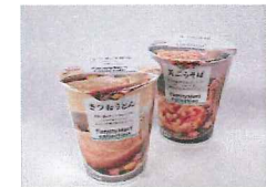
国連WFP協会 「RED CUP CAMPAIGN」 FamilyMart collection カップ類