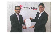
2013/7/22 セーブ・ザ・チルドレン・ジャパンにお届け