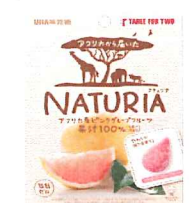
NNUTURIA(ナチュリア)ピンクグレープフルーツ 寄付付きグミキャンデー