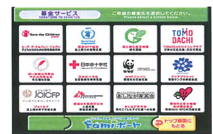
ファミポート募金画面トップ