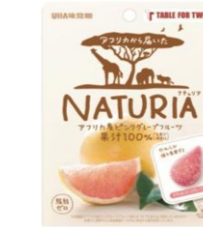
NNUTURIA(ナチュリア)ピンクグレープフルーツ 寄付付きギミックンデー