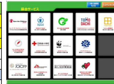
ファミポート募金募金画面トップ