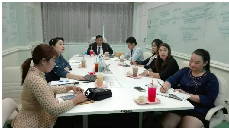
OBEC との打ち合わせで、様々な 機関との連携について話し合う (2017年11月28日)