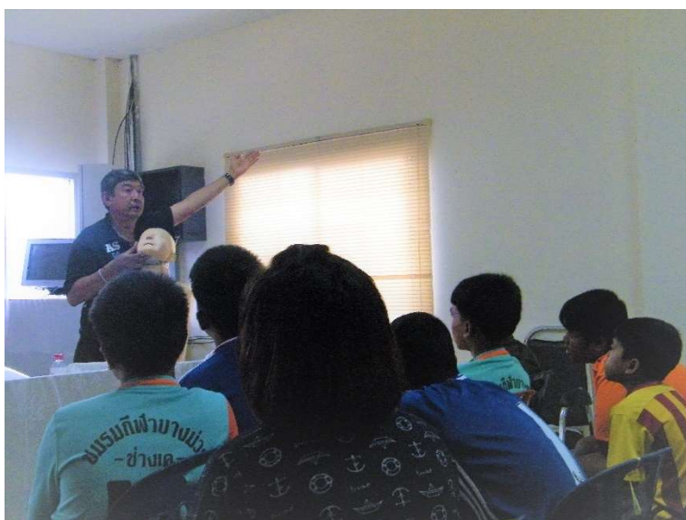
パンガー県で行われている事業 の視察。子ども向けの救急法に ついての講義を見学する(2017 年10月11日)