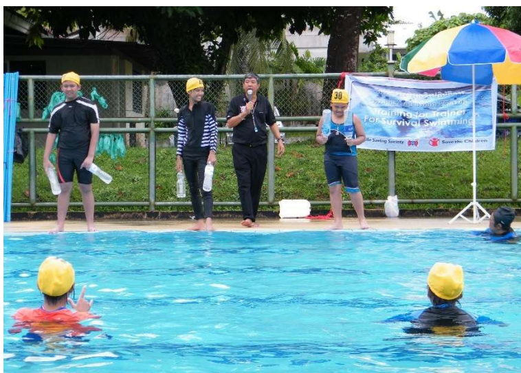
パンガー県で行われている事業 の視察。プールで行われている 救助方法に関する訓練を見学し た(2017年10月12日)