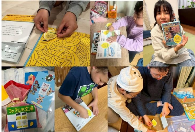
贈り物にラッピングや絵本にステッカーを貼る様子