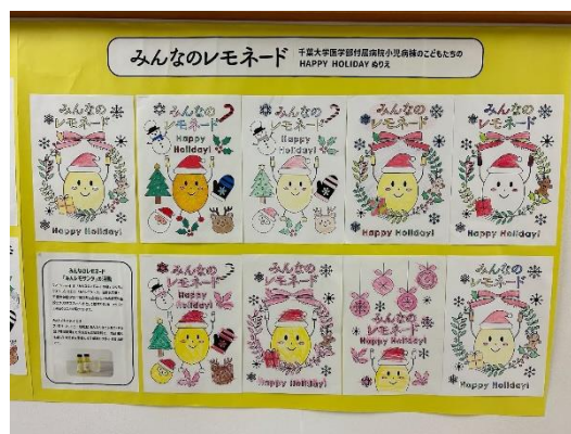
掲出した店頭の写真