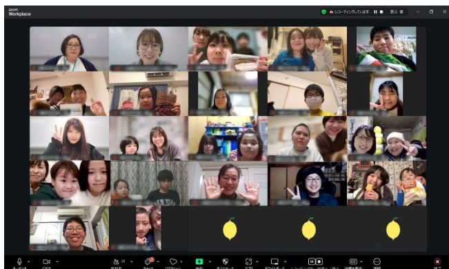
みんなレモサント会議の様子

当社社員も各地のプレゼントの状況を報告し合う「みんなレモサント」会議に参加し、こどもたちがどんなプレゼントを用意したのか、発表していただきました。入院中のこどもたちが楽しめる本や DVD など、様々なプレゼントを用意し、プレゼントには、本取り組みの目印としてオリジナルステッカーを貼っています。