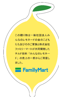
オリジナルステッカー