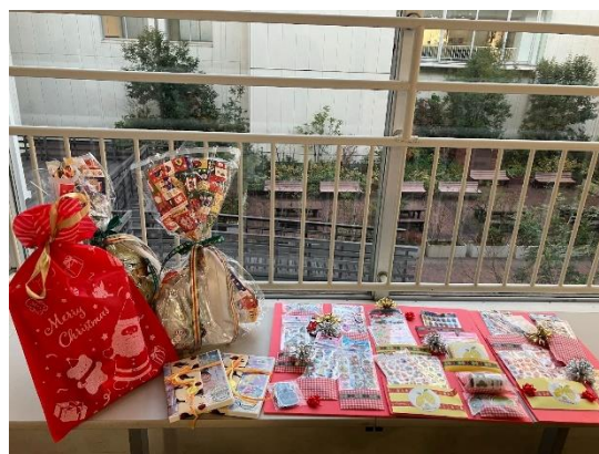
当日の様子やお渡ししたクリスマスプレゼント