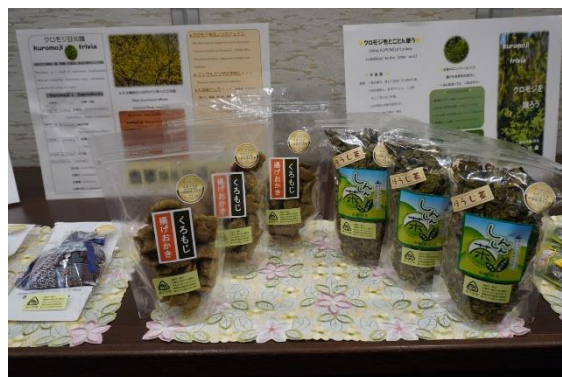
クロモジを使った商品