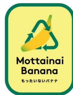
もったいないバナナのロゴマーク

株式会社ドールと連携したこの取り組みにより、より多くのバナナを廃棄から救い、サステナブルな循環を生み出すことが可能となりました。お買い物の際に「おいしい」を選んでいただくことが、そのまま地球に優しいアクションにつながります。パッケージにはその証として、おなじみの「もったいないバナナ」ロゴを表示しています。ぜひお近くの店舗でお確かめください。