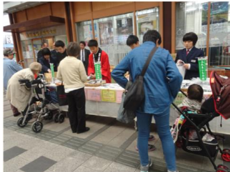
毎年楽しみにしてくれているお客さまもいらっしゃいます！