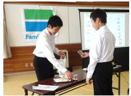
お客さまをお迎えする姿勢や袋詰めも練習しました。何度も練習を重ねます。