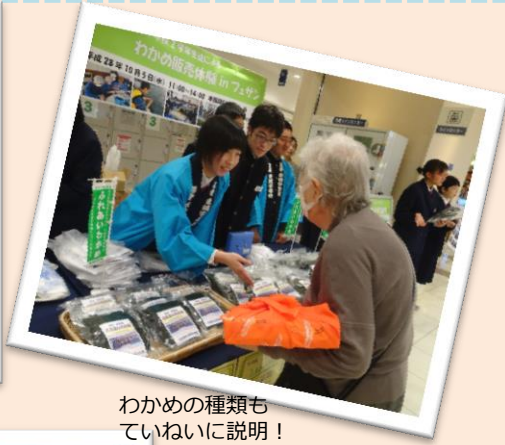
わかめの種類もていねいに説明！