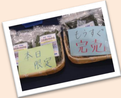
POPも工夫して販売を促進！

販売日当日、生徒の皆さんは2班にわかれて盛岡市内2ヶ所で、販売実習を体験。授業で作成したPOPを貼って、一生懸命つくった「ふれあいわかめ」をきれいに陳列。作ったチラシを大きな声で配布して歩いたおかげで、たくさんの方に来てもらえました。みんなで協力しあいながら頑張った成果があり、販売予定数の800袋は完売！販売に間に合わず、「売切れちゃったの？」と残念がるお客さまもいらっしゃいました。