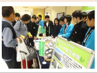
800袋すべて完売しました！お疲れ様でした！