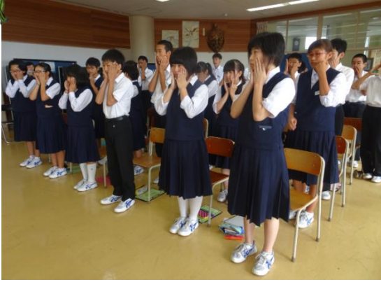
まずは、いい笑顔で接客するために、顔の筋肉をほぐします！