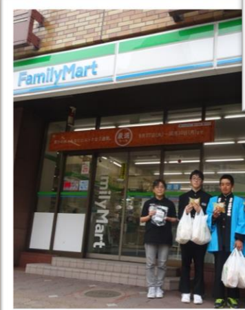
ファミリーマートメトロポリタン盛岡店の店長とマネジャーも毎年わかめを購入して応援してくれます！