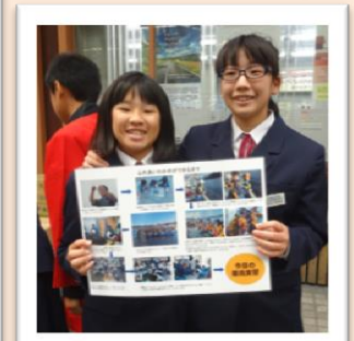
末崎中学校の私たちが心をこめてつくりました～