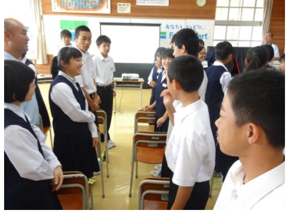
2人1組になって、お互いの笑顔をチェックします。

「いらっしゃいませ。こんにちは」「ありがとうございました。またお越しくださいませ」の挨拶の練習も行い、二人一組でお互い何度もチェックをしました。そして、売り手とお客さま役に分かれ、レジでの接客販売の実習も体験。代金を受け取り、商品をお渡しする、おつりをお渡しする…最初はぎこちなかった皆さんも、練習を重ね笑顔で「いらっしゃいませ！」の声も元気に出来るようになりました。初めての体験で、販売当日が楽しみです！