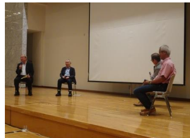
東京都の森・川・海についてのトークセッションも行われました。