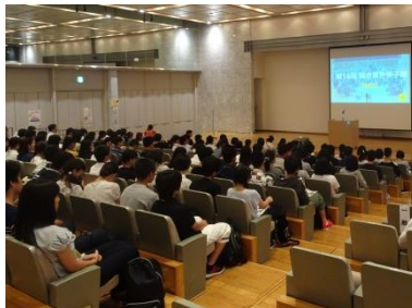
参加高校生100名が全国から集合。これから始まる聞き書き甲子園に緊張しながらも期待に溢れた面持でした。