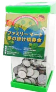
レジ横にある募金箱

http://www.family.co.jp/company/csr/commitment_to_society/action/bokin.html