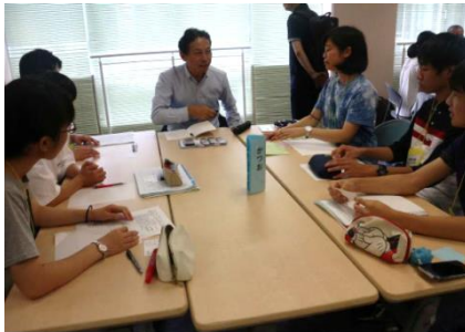
社会人先輩を呼び、実際に聞き書きをします。ファミリーマート社員も話し手として参加しました。