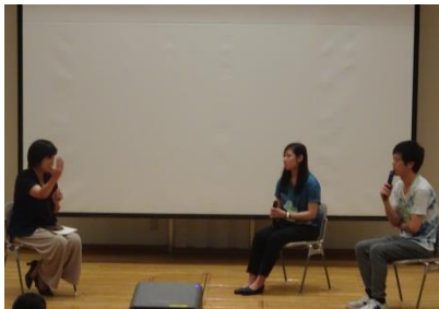
卒業生トークの様子。大学生メンターとして参加する卒業生が自身の経験を語りました。