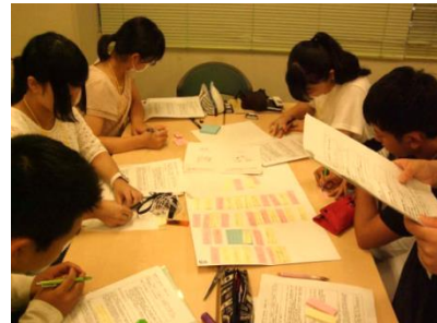
聞き書きした内容をまとめます。初めての聞き書きに戸惑い、作業は夜遅くまでかかりました。