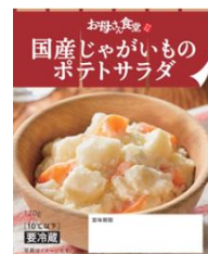
買い置き可能な スタンドパック商品