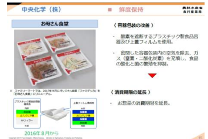
「お母さん食堂」紹介ページ

「お母さん食堂」の容器包装での取り組みが鮮度保持の点から食品ロス削減に役立つものとして、食品ロスの削減に資する容器包装の高機能化事例集に掲載されました。