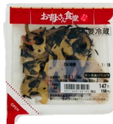
食べきりサイズの トレイパック商品

夕食のおかずにもそのまま出せるような即食需要に対応した、食べ切りサイズのトレイパック商品をはじめ、翌日のお弁当のおかずや、週末の献立のために買い置きができるスタンドパック商品など、様々なシーンに沿った豊富な品揃えで、家庭の食卓を応援しています。