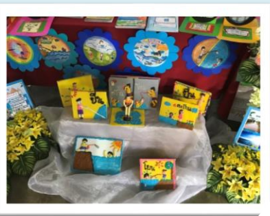
生徒たちが作成した 水難事故防止の教材や作品