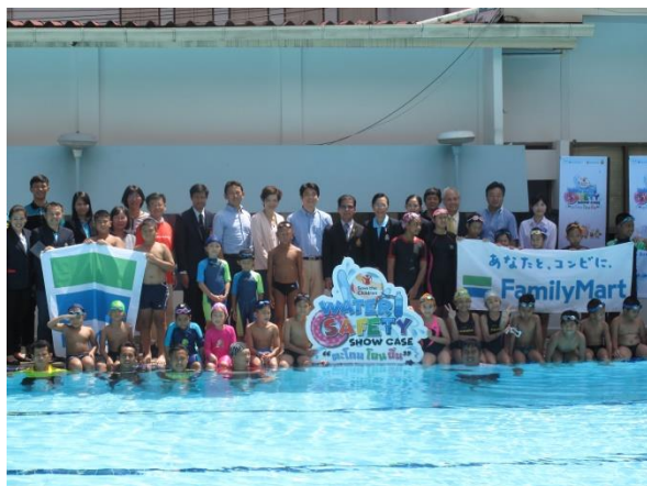
今回のプログラムに参加した行政、学校関係者、セントラルファミリーマートが生徒たちと集合

タイでは2013年度より毎年こどもの防災事業を行っており、今年度もその取り組みの一環として8月4日（土）に「水難事故防止のための水泳教室」を実施しました。今回の活動はファミリーマート、セントラルファミリーマート（タイ）、セーブ・ザ・チルドレンの3者の協働事業として開催しました。