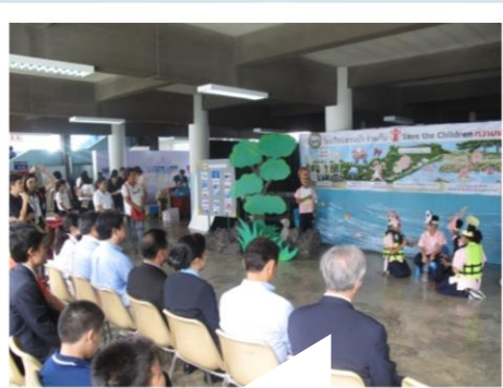
生徒が"Alert Little Tun"の アニメーションを演技