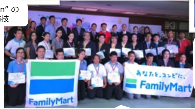
セントラルファミリーマート、ファミリーマート、 セーブ・ザ・チルドレン、教員の方々と記念写真

ファミリーマートは、事業活動を通じて常にお客さま、地域社会、そして地球を幸せにする存在となることを目指します。