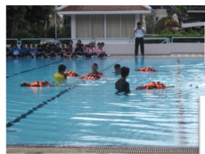
実際にプールで 水の中での浮き方 を学びました。