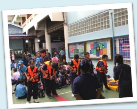
ライフジャケットの 着用方法の勉強

タイでは、多くの学校にプールがなく、こどもの水泳教育が充実していないため、水害時に15歳以下のこどもが亡くなる最も多い原因が溺死となっています。水害に対するこどもの意識を向上させ、災害時の事故を減らすために、泳法や救助方法を学ぶ「水難事故防止の水泳教室」を行いました。この活動にはバンコク市内の学校から小学生や教員の方々を含め約300名が参加しました。