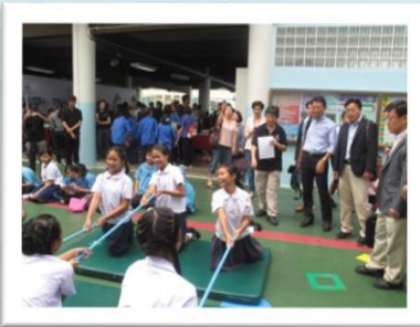
近距離で溺れている人にパイプ を渡し、陸上から救助！