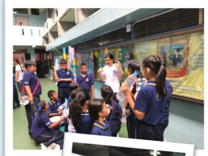
ペットボトル、ロープなど の浮具を投げて、救助！

溺れている人を見かけた場合、「声をかける、投げる、渡す」という3つの対応方法を学びました。