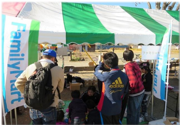
水風船釣りのブースにもたくさんのお客さまにお越しいただきました

下仁田町は県の中でも過疎化の深刻な地域と言われています。今年の活動は今回のねぎサミットをのお手伝いをもって終了しますが、地域社会と共生するファミリーマートとして皆様に協力したいと考えています。