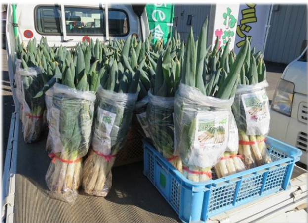
トラックいっぱい積み込まれ、食卓に並ぶのを待つ下仁田ねぎたち