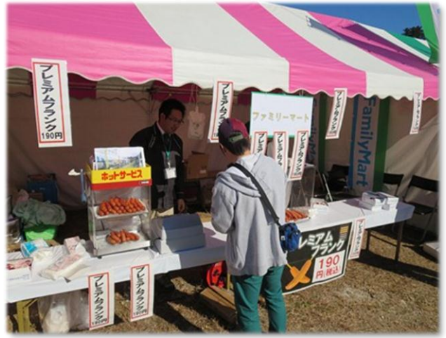
ファミリーマートブースにてプレミアムフランクを販売！多くのお客さまにお召し上がりいただきました

全国18産地のねぎの販売ブースでは、ねぎを使った料理の試食がふるまわれ、本場のねぎの味を食べ比べておいしさを楽しみました。3万人を超える来場者が集まる中、ファミリーマートブースにも多くのお客さまが足を運んでくださいました。