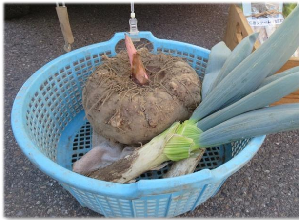
かぼちゃと見間違えるほどの大きなこんにやく芋！（3年もの）