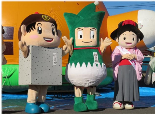
下仁田町のキャラクター「ねぎ坊」と「にやくっち」の他「ぐんまちゃん」や各地のご当地キャラクターも大集合！