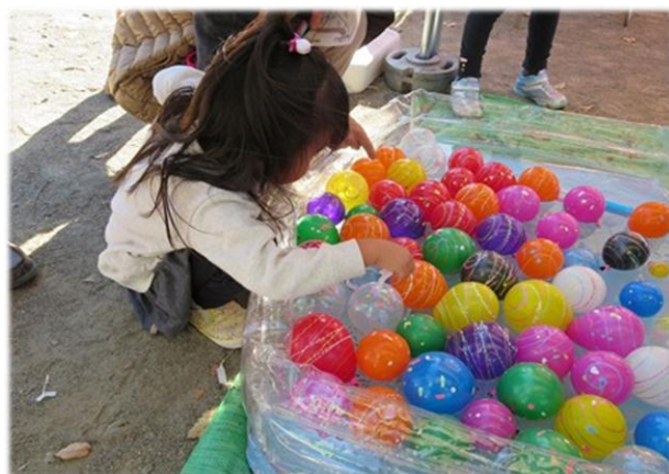
水風船釣りに挑戦。上手に釣れるかなあ？