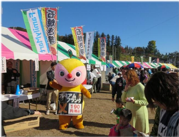
ファミリーマートの環境キャラクター「エコロン」も一緒に販売のお手伝いをしました

前日までのぐずついた空模様がうそのように、当日は雲一つない晴天にめぐまれ絶好のお祭り日和。ファミリーマートは会場の2か所に出店し、メイン会場では今年8月に新登場した「ファミプレミアムシリーズ」の「プレミアムフランク」を販売しました。お客さまの呼び込みにはファミリーマートの環境キャラクター「エコロン」もお手伝いにつけ、子どもたちに囲まれながらも商品をしっかりとアピールしてくれました。