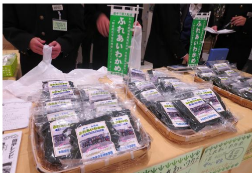
陳列もきれいにできました。