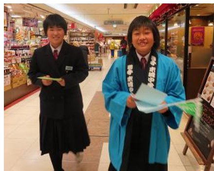
「私たちがつくった“わかめ”いかがですか〜」という声に、沢山のお客さまが来てくださいました。