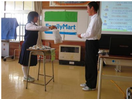
皆の前で練習の成果を発表し、良いところを皆で共有しました。