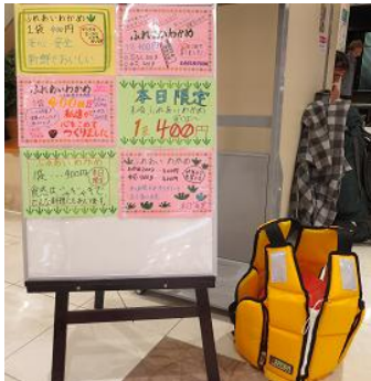
作成したPOPも工夫して展示。

販売日当日、盛岡市内2ヶ所で生徒の皆さんは2班に分かれて、販売実習を体験。授業で作成したPOPを貼って、自慢の「ふれあいわかめ」をきれいに陳列。自分たちでつくったチラシを大きな声で配布して歩いたおかげで、たくさんの方に来てもらえました。みんなで協力しながら頑張った成果があり、販売予定数の718袋は見事に完売！