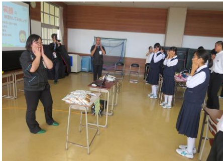
まずはいい笑顔をつくるため、顔をほぐします。意識して笑顔をつくるのって意外と大変！

「いらっしゃいませ。こんにちは」「ありがとうございました。またお越しくださいませ」と唱和し、挨拶の練習も行いました。また、生徒の皆さんが売り手とお客さま役に分かれ、販売の実習も体験しました。お金を受け取る、商品をお渡しする、おつりをお渡しする…最初はぎこちなかった皆さんも、練習を重ね笑顔で「いらっしゃいませ！」の声も出せるようになりました。あとは本番当日の販売実習を待つばかりです！