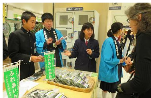
さあ、いよいよ販売のスタートです！