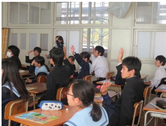
クイズを交えながらファミリーマートについて学んでいます。