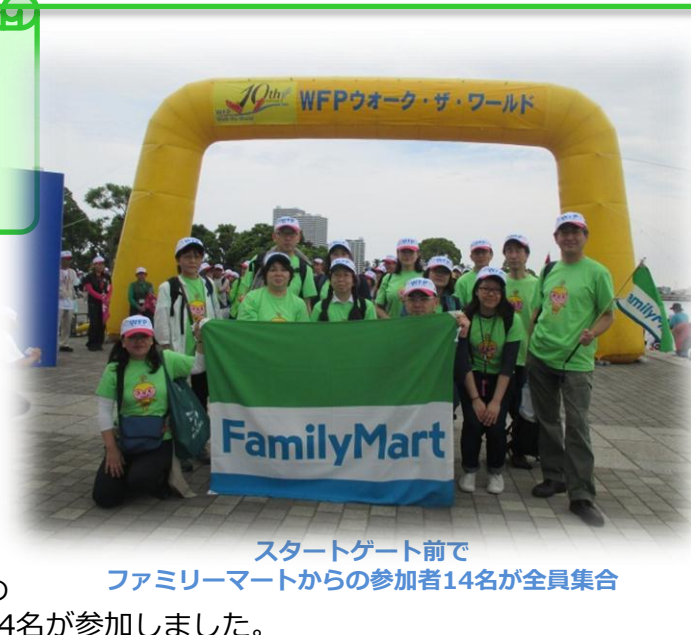
スタートゲート前で ファミリーマートからの参加者14名が全員集合

ウォーク・ザ・ワールドは、途上国の子どもたちの飢餓をなくすために国連WFP協会が開催するチャリティーウォークで、参加費の一部が子どもたちが健康に学校に通い続けるための学校給食を届ける、国連WFPの学校給食プログラムに役立てられるものです。ファミリーマートは店頭募金を通じて国連WFPの活動を支援しており、今回のチャリティーウォークには社員の家族を含めて総勢14名が参加しました。