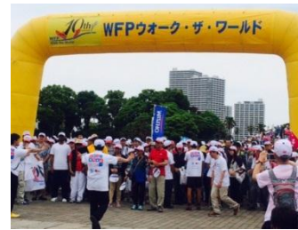
いよいよスタートです

ファミリーマートはこれからもこのような次世代を担う子どもたちの育成の取り組みを支援してまいります。