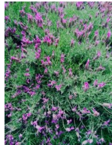
満開のラベンダー。 花を愛でながらのウォーキングは 最高です。