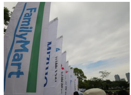
協力企業がずらり

ファミリーマートは、事業活動を通じて常にお客さま、地域社会、そして地球を幸せにする存在となることを目指します。