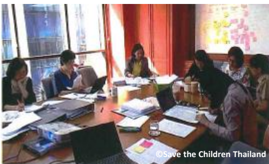
長時間に及んだ選考会の様子