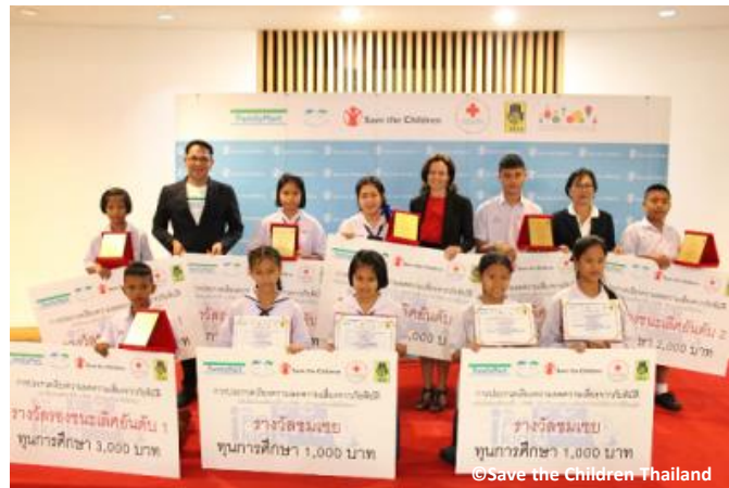
防災エッセイコンテストの受賞者

その一環として、「災害リスク軽減のために子どもたちが果たせる役割」をテーマとした防災エッセイコンテストを実施。ファミリーマートの現地法人セントラルファミリーマートは、選考から参加し、受賞者への表彰を行いました。