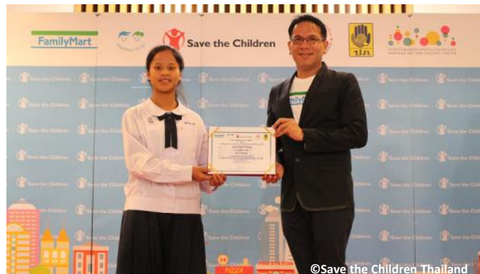
セントラルファミリーマートの社員が「ファミリーマート賞」を小学生部門と中学生部門の受賞者2名に手渡しました