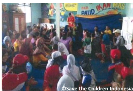
チリンチン地区の学校2校の子どもたちが参加しました