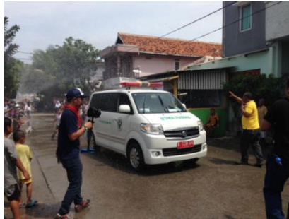
保健省は救急車を稼働し、負傷者救援訓練を実施