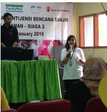
生徒と地域住民に防災訓練の実施方法を説明する様子