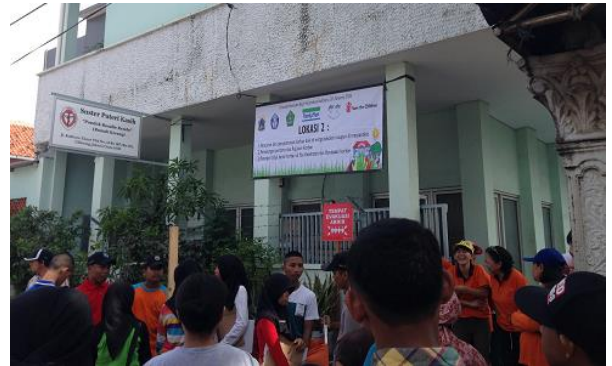
地域住民を含む約1,000人の人々が避難訓練に参加

2015年度、インドネシアでは「北ジャカルタの学校における防災能力向上プログラム」としてチリンチン地区で1,000人規模の避難訓練が実施。インドネシアファミリーマートからも社員ボランティアが参加し、地域共生につなげています。