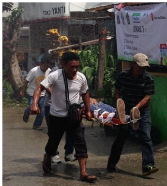
捜査と救助チームが重傷者を救助している訓練の様子