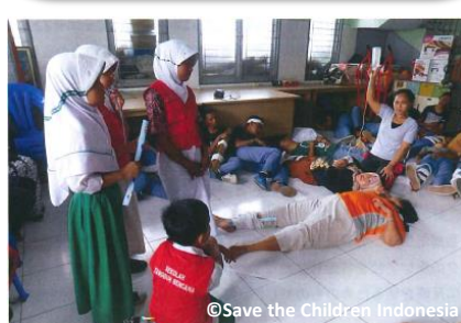
応急処置訓練を行う避難所