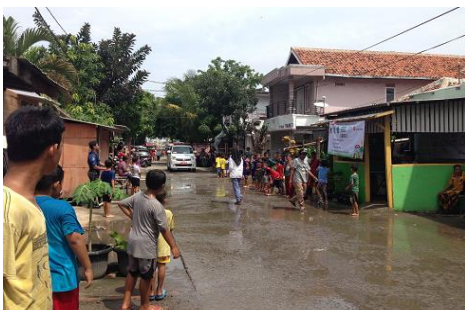
避難訓練を実施したチリンチン地区

毎年洪水の被害を受けている北ジャカルタのチリンチン地区において、学校における活動ならびに学校周辺コミュニティとの連携を通じて、こどもたちの自然災害に対する防災適応能力の更なる向上と定着を目指す。