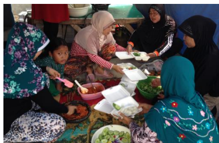
野営炊事チームが炊き出しの準備をする様子