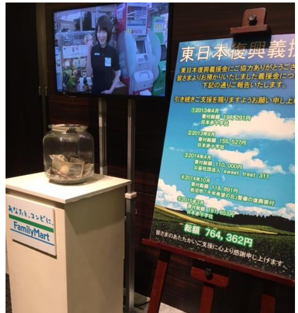
2016年4月 加盟店政策発表会での義援金活動ブース

2016年4月度の加盟店政策発表会では54,367円の義援金を東日本復興義援金募金として、公益社団法人チャンス・フォー・チルドレン（東日本被災地教育支援活動）に寄付致しました。