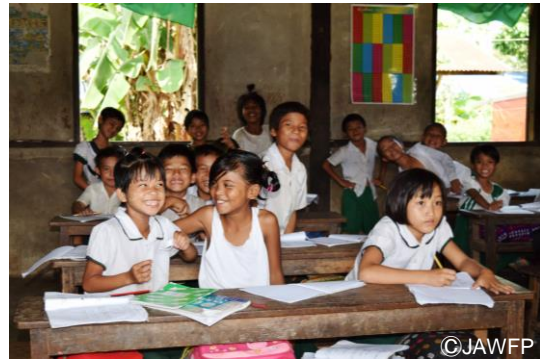
小学校の教室の様子