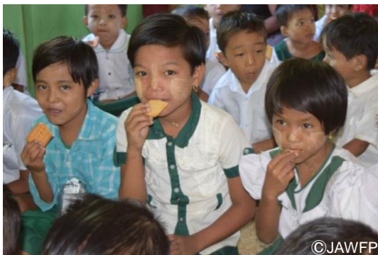
栄養強化ビスケットを食べる子どもたち